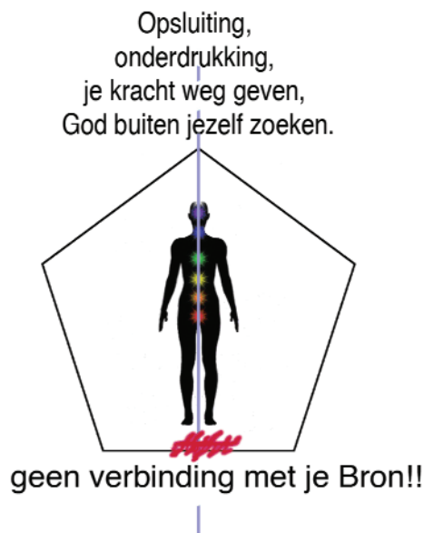
Figuur 2 De zespuntige energiestructuur van verbinding

staat, deze kent en begrijpt vanuit dualisme en vanuit een tijd en ruimte ervaring. Naast deze vijfpuntige geometrische structuur is nu een nieuwe aarde grid ontstaan met min of meer een zespuntige matrix. Deze nieuwe aarde grid is in 2012 geheel klaar. Deze zespuntige matrix heeft een veel hogere bewustzijnskwaliteit en draagt en ondersteunt de energie en het bewustzijn van de toekomstige fase waarin de mensheid aan het komen is.